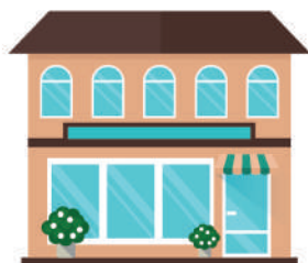
ИНЫЕ ЗДАНИЕ, СТРОЕНИЕ, СООРУЖЕНИЕ