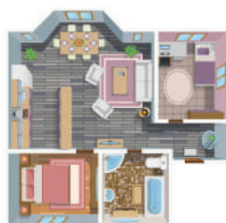
КВАРТИРА (ЧАСТЬ КВАРТИРЫ, КОМНАТА)