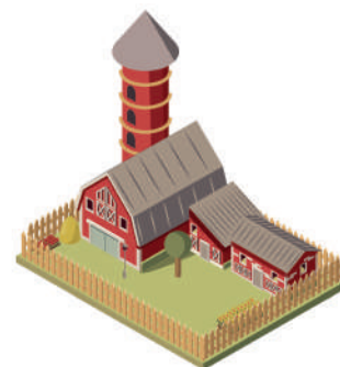
ЕДИНЫЙ НЕДВИЖИМЫЙ КОМПЛЕКС